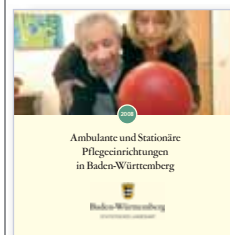
Artikel-Nr. D1226 08001