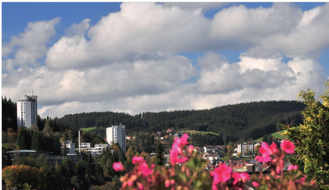
Panoramaansicht von Furtwangen im Schwarzwald

schnitt von etwa 46 %. Die Waldfläche beträgt 63 % und liegt damit über dem Durchschnitt des Landkreises Schwarzwald-Baar (46 %) und des Landes (38 %). Gut 6 % der Fläche sind besiedelt oder dienen als Verkehrsfläche.