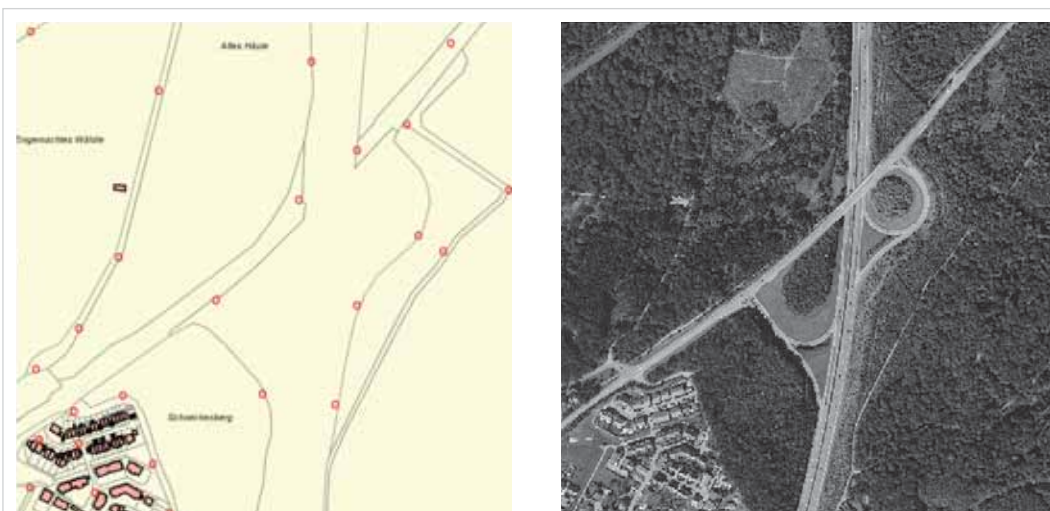
Abbildung 4: Autobahn A81 Anschlussstelle Ehningen.

Vordringlichste Aufgabe des Liegenschaftskatasters ist die buchmäßige Verwaltung der Flurstücke und die Bereitstellung der Geodaten. Dafür wurde es konzipiert, eingerichtet und stetig weiterentwickelt. Diese Originäraufgaben erfüllt das Liegenschaftskataster in anerkannt guter Qualität. „Unschärfen“ zeigen