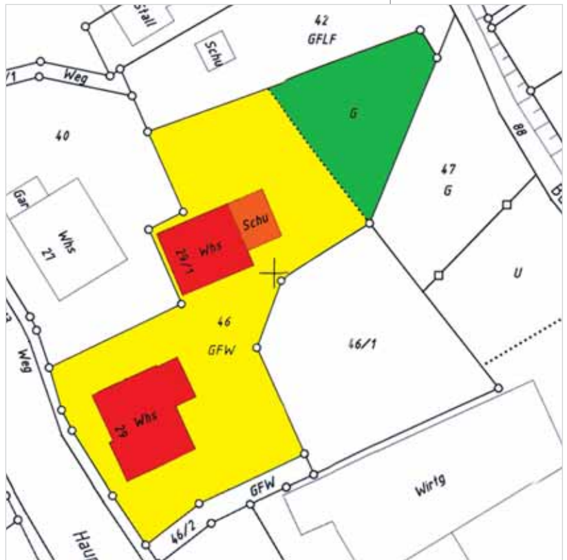
Abbildung 3: Flurkarte.

Ein ganz anderes Problem stellt die Nutzungsänderung im Bestand für die Aktualität und Richtigkeit des Liegenschaftskatasters dar. Typisches Beispiel hierfür sind landwirtschaftliche Anwesen, die im Zuge des Strukturwandels die landwirtschaftliche Produktion aufgegeben haben. Damit dürfte die Hofstelle eigentlich nicht mehr unter dem Nutzungsartenschlüssel „270 Gebäude- und Freifläche Land- und Forstwirtschaft“, sondern angesichts der geänderten Hauptnutzung ggf. unter „130 Gebäude- und Freifläche Wohnen“ oder ähnlichem verbucht werden. Dass diese Nutzungsänderung nur auf dem Antragsweg Eingang ins Kataster findet und dann noch gebührenpflichtig ist, steht der von der Sache her gewünschten Aktualisierung häufig entgegen. Diese Praxis führt dazu, dass die Gebäude- und Freifläche Land- und Forstwirtschaft tendenziell nicht ab-, sondern sogar zunimmt. Und zwar dann, wenn ein Betrieb aussiedelt oder im Außenbereich neue Produktionsanlagen errichtet werden.