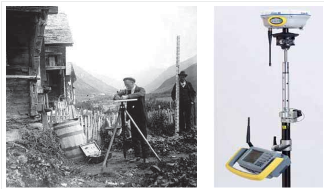
Abbildung 2: Vermessung gestern und heute: Tachymeter – GPS-Empfänger.

In Baden-Württemberg sind die staatlichen Vermessungsämter der Landkreise und die städtischen Vermessungsdienststellen für die Führung des Liegenschaftskatasters zuständig. Des Weiteren sind die Flurbereinigungsverwaltungen der Landkreise und öffentlich bestellte Vermessungsingenieure berechtigt, Katastervermessungen durchzuführen.