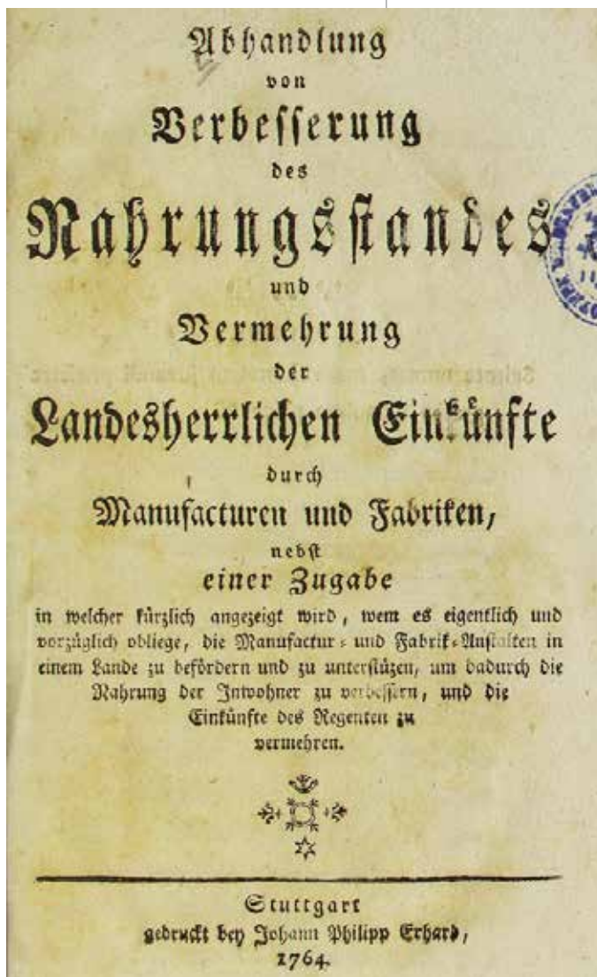
Abbildung 2: Titel der Erstausgaben von Johann Friedrich Müllers Schriften von 1752 und 1764.

kette räumlich möglichst konzentriert sein. Möglicherweise hatte Müller neben der nahe liegenden Einsparung von Transportkosten, die damals ein relativ größere Bedeutung gehabt haben dürften als heute, auch einen Wissensaustausch im Sinn, was aber letztlich offen bleiben muss. Ferner müssen ausreichend Arbeitskräfte vorhanden sein, und diesbezügliche Konkurrenz zur Landwirtschaft soll vermieden werden. Dem heute sogenannten primären Sektor räumt Müller tatsächlich den Primat ein – der gewaltige, Arbeitskräfte freisetzende Produktivitätssprung durch die Technisierung der Landwirtschaft, der das 20. Jahrhundert begleitete, war noch nicht absehbar.