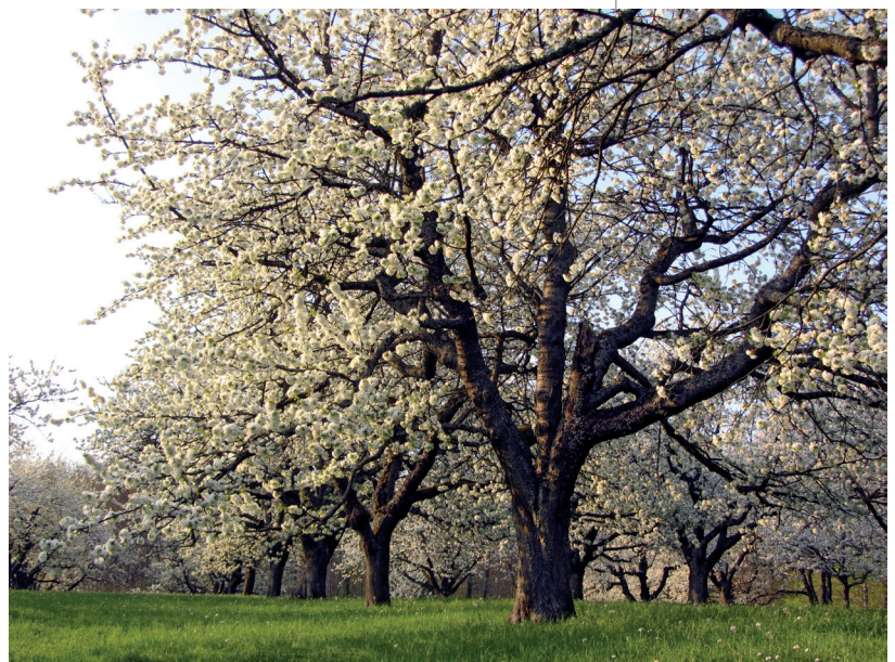
Kirschblüte auf der Streuobstwiese

Die nach der dargestellten Methode für das Jahr 2005 erhobene Streuobst-Baumzahl umfasst 9,3 Mill. Bäume (ohne die Bestände innerhalb der Siedlungsgebiete) auf 116 000 Hektar. Im Vergleich zur letzten Erhebung im Jahr 1990 haben die Streuobstbestände 2005 damit um 2,1 Mill. Bäume abgenommen. Knapp die Hälfte der Bäume waren Apfelbäume, etwa 25 % Kirschbäume. Darauf folgten